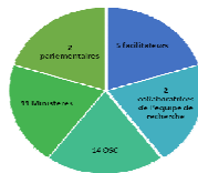
Figura 2. Participantes do workshop das partes interessadas do SRAJ